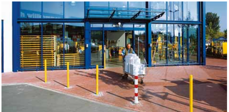
O65 RTA masszív, betörésbiztos tolóajtó – barkácsáruház, Németország