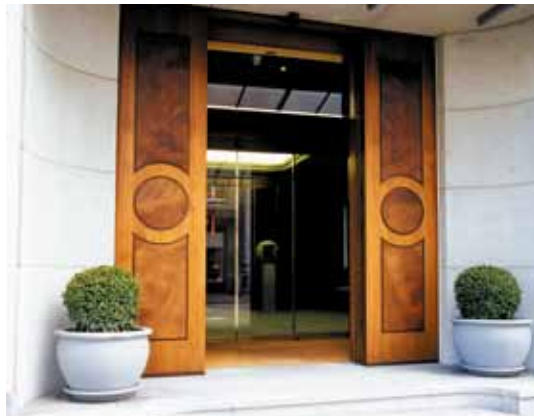
Betörésbiztos ajtó – bank, Svájc