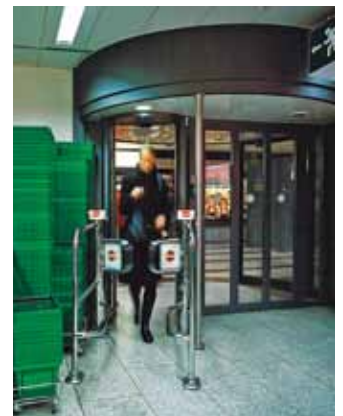
record FlipFlow – szupermarket, Svájc