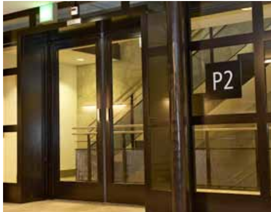
Automata tűzgátló ajtó – többszintes parkolóház, Svájc

A record FlipFlow egy automata bejárati rendszer egyirányú forgalommal. A rendszer egy kétszárnyú lengőajtóból, és két automatikus korlátból áll. Ha az áthaladó személy visszafordulna, a korlátok automatikusan elzárják az utat. A lengőajtó-szárnyak azonnal becsukódnak és zárnak, az eseményről pedig jelentést kap az épület ellenőrzési rendszere. Mivel könnyedén beépíthető a már meglévő biztonsági rendszerekbe, a FlipFlow-t Európa-szerte számos olyan nyilvános épületben alkalmazták, ahol a biztonság alapkövetelmény. Ideális megoldásként alkalmazhatók második bejáratként szupermarketekben, bevásárlóközpontokban és pályaudvarok üzleteiben.