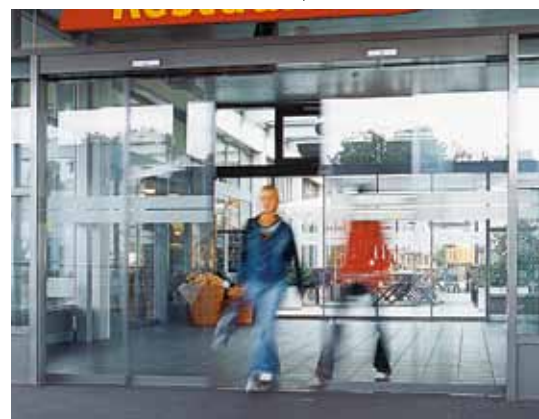
Teleszkópos tolóajtó – Étterem, Svájc