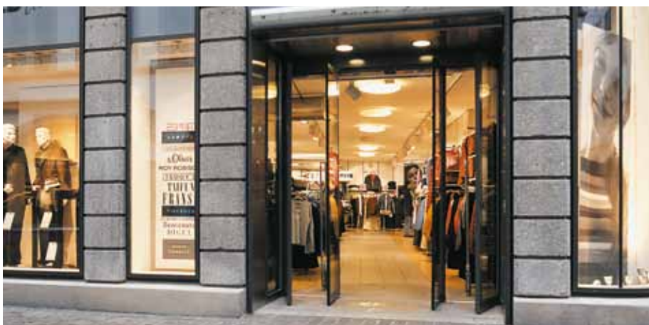
Teljes nyitású tolóajtó – divatbutik, Svájc