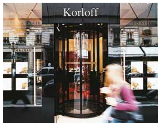
Köríves tolóajtó – Ékszerbolt