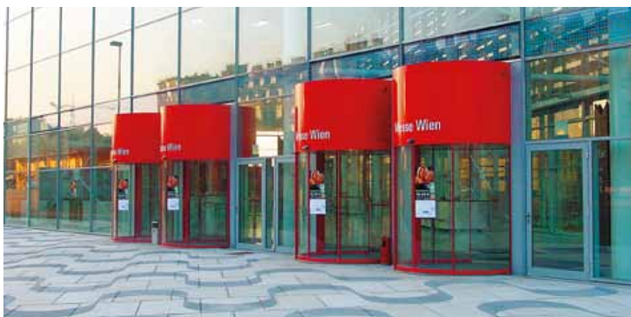
Köríves tolóajtó – Kiállítócsarnok, Ausztria