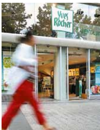
Tolóajtó – Kozmetikai szaküzlet

A record SPEEDCORD ütközésálló gyorskapu – beltéri használatra. Jól alkalmazható két eltérő hőmérsékletű tárolóterület kapcsolataként. A gyors nyitási és zárási sebességek rövidítve tartási ciklust jelentenek, amely megakadályozza a hőcserét.