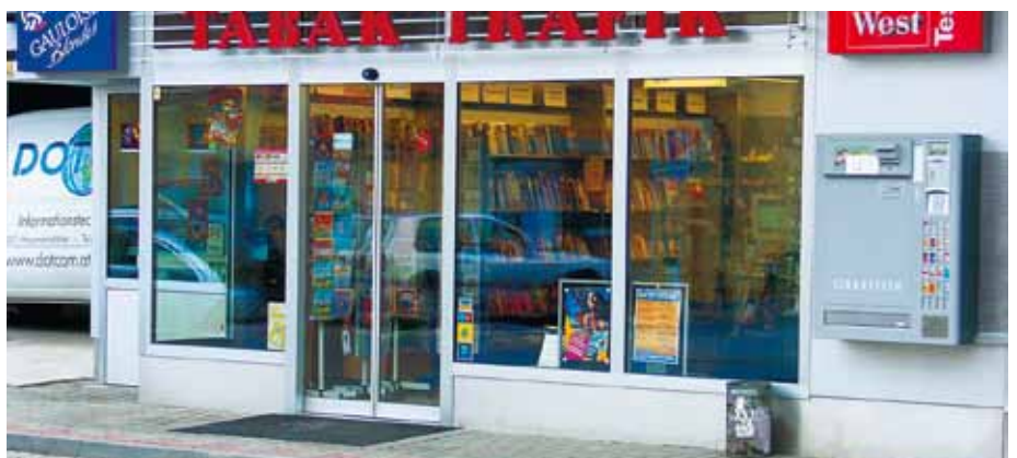
Betörésbiztos ajtó – dohánybolt, Ausztria