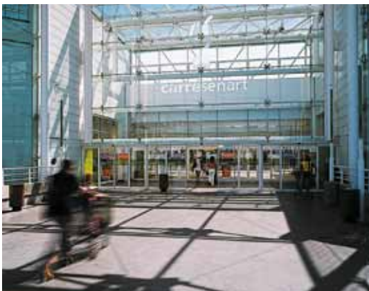
Teljes nyitású tolóajtó – bevásárlóközpont, Svájc