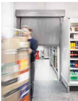
Gyorskapu – ütközésálló megoldás – raktár, Svájc