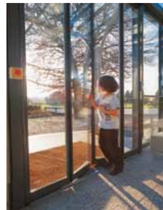
record FTA 20 FBO harmonikaajtó pánikvasalattal