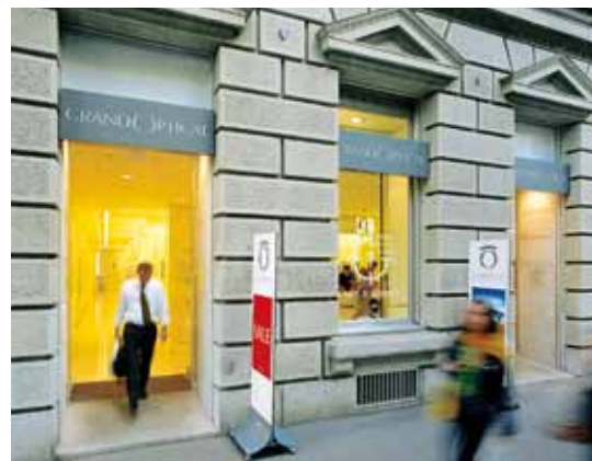
Tartalék tolóajtó menekülési útvonalhoz – Optikus, Svájc