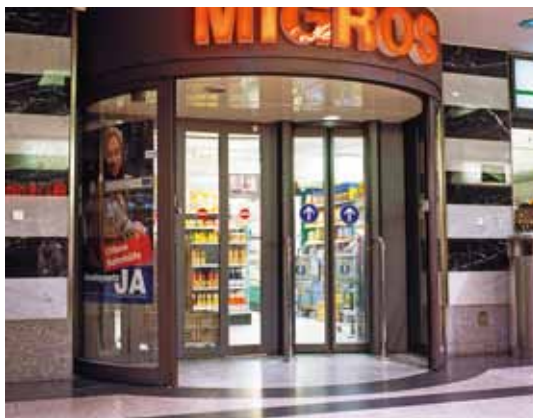
Forgóajtó – Üzletlánc, Svájc