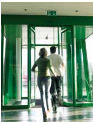
TOS – vészkijárat, Svájc

A RED modell speciális menekülési útvonalakhoz készült. A rendszer lényege, hogy minden fontos részegység duplikálva van, mely 100%-ban biztosítja, hogy egy vésznyitás még egy igen ritka – ám elméletileg lehetséges – műszaki probléma esetén se hiúsulhasson meg.