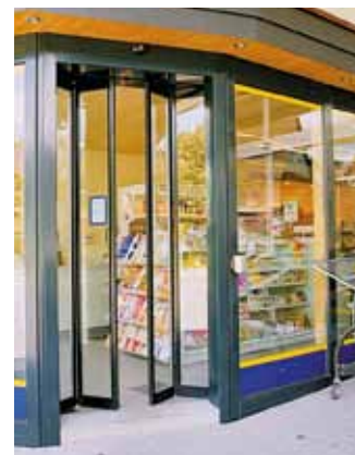
Harmonikaajtó – keskeny kijárat – Kis üzlet, Svájc