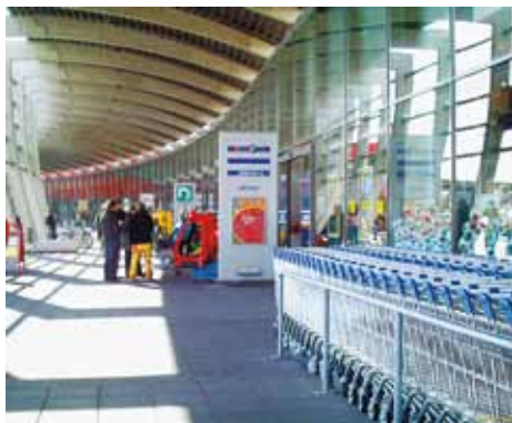
Bevásárlóközpont – Fulda, Németország